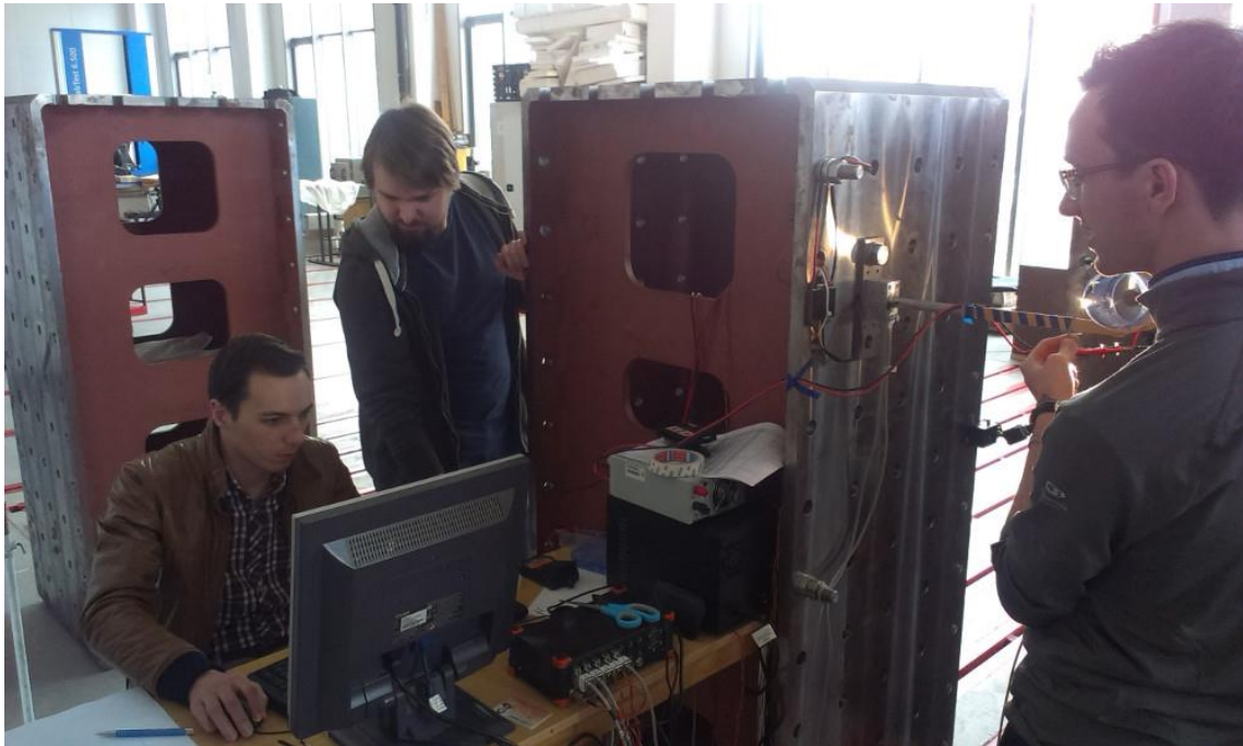
Obr. 3: Studenti LU při testování vrtule B

Studenti 4. ročníku se do testování vrhli s maximálním zaujetím (Obr. 3).